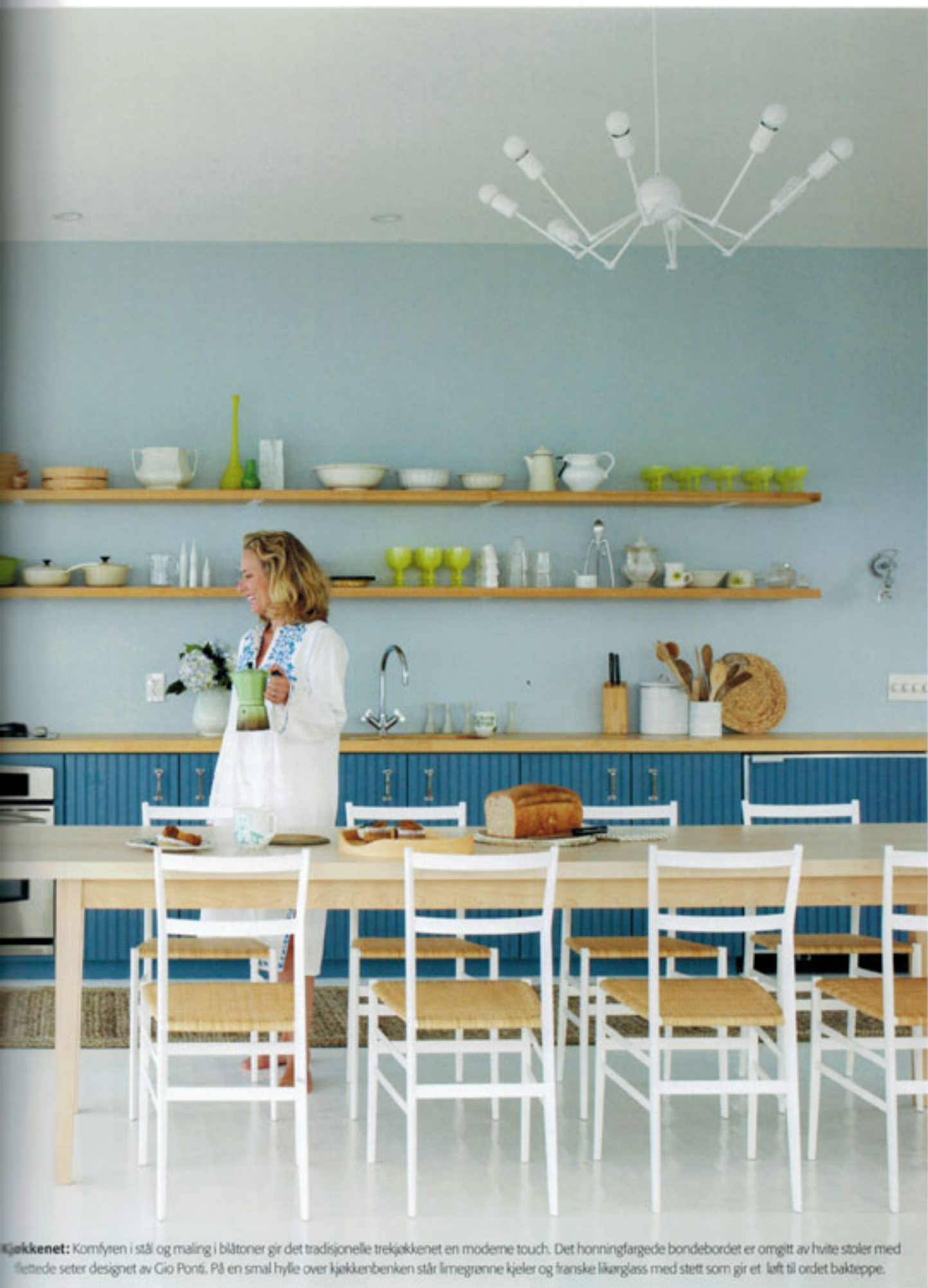
Kjøkkenet: Kornfyren i stål og maling i blåtoner gir det tradisjonelle trekjøkkenet en moderne touch. Det honningfargede bondebordet er omgitt av hvite stoler med flettede seter designet av Gio Ponti. På en smal hylle over kjøkkenbenken står limegrønne kjeler og franske likørglass med stett som gir et løft til ordet bakteppe.